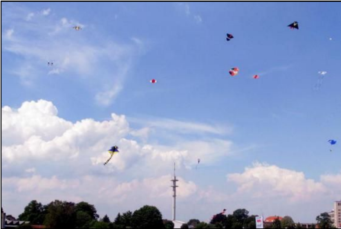
Kleinere Drachen konnten trotz der Flaute aufsteigen.

GREVEN Flaute am Himmel, Drachen am Boden. Der Wettergott war dem Drachen- und Familienfest am Wochenende wohl nicht gewogen, kräftiger Wind blieb jedenfalls aus. Von Judith Bahmann